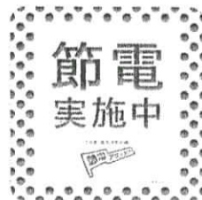
節電宣言ステッカー

節電行動計画を、政府の節電ポータル サイト「節電.go.jp」で公表いただく皆さまには、「節電宣言ステッカー」を差し上げます。 オフィスの受付に、店舗の入り口に提示 しましょう。