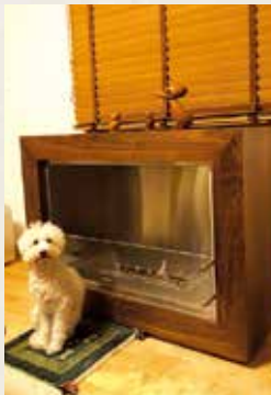
N様の暖炉前は愛犬の定位置なのだそうです

暖炉は進化して、今は煙突も薪もいらな。しかもマンションでも置ける手軽な暖炉『バイオエタノール暖炉』をご紹介します。